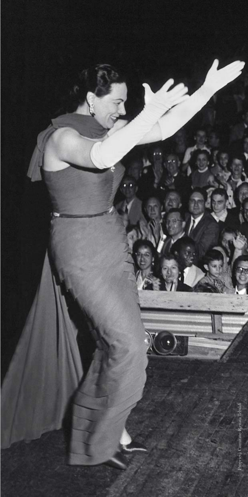
Proprietà Comitato Renata Tebaldi

Il Palazzo del Governatore, grande e prestigioso monumento divenuto prezioso spazio espositivo nel cuore della città, riportato a originario splendore con il recente restauro che ne ha ampliato e riorganizzato gli spazi, le ampie sale, moltiplicandone la vocazione e le potenzialità, apre le sue sale per ospitare un solenne omaggio, ancor più che una mostra, a Renata Tebaldi, una delle più grandi artiste del Novecento, mitica ambasciatrice di italianità nel mondo e, insieme, un dono alla città di Parma, culla dei primi passi sulla via dell'arte della celebre cantante.